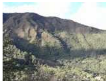
La micro-cuenca del Fuerte (izquierda)... y la micro-cuenca del Chorrillo (derecha)